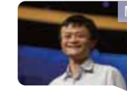
MA YUN, AZ ALIBABA GROUP IGAZGATÓTANÁCSÁNAK ELNÖKE

Shenzhen fejlődése minden elképzelésemet felülmúlja, csoda, hogy 30 év alatt ennyi mindent elérték.