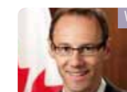
Weldon Epp, KANADA FŐKONZULJA GUANGZHOU-BAN

Shenzhen gyönyörű város. Rendkívül rövid idő alatt olyan kulturális eredményeket ért el, amelyek más városoknak évekbe telnek. Elmondhatom, hogy tanúja voltam Shenzhen fokozatos fejlődésének, mivel időről időre meglátogatom a várost. Véleményem szerint, Shenzhen nemcsak Kína, hanem a világ tekintetében is egy élhető város.