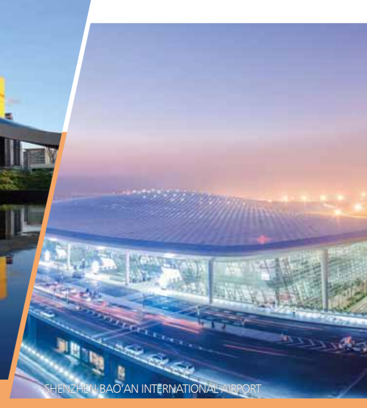
SHENZHEN BAO'AN INTERNATIONAL AIRPORT