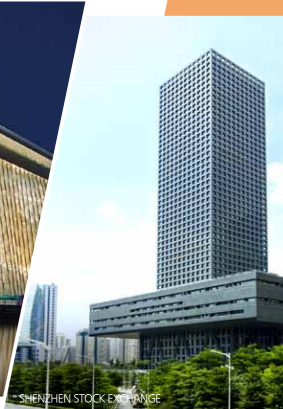
SHENZHEN STOCK EXCHANGE