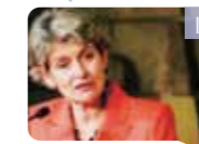
IRINA BOKOVA, AZ UNESCO FŐIGAZGATÓJA

Shenzhen tiszta, zöld város, várostervezés szempontjából az egész város elrendezése és építészete gazdag, tele van étellel és individualitással. Shenzhen lenyűgöző, dinamikus, fenntartható város. Szeretném jókívánságaimat kifejezni a Shenzhenben élő embereknek.