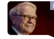
BUFFETT, A BERKSHIRE HATHAWAY ELNÖKE

A fenntartható fejlődés kulcsa a kultúra és Shenzhen egyike azon városoknak, ahol ez az elv a gyakorlatban is megvalósul.