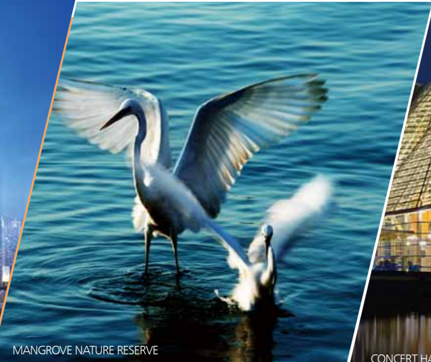
MANGROVE NATURE RESERVE