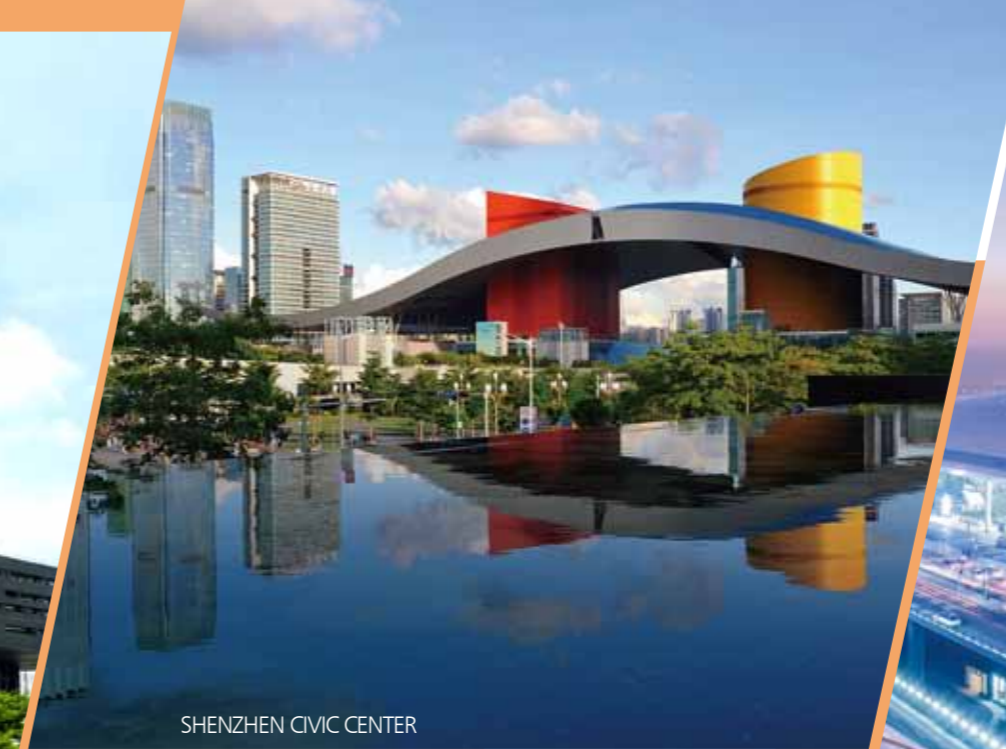
SHENZHEN CIVIC CENTER