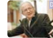
DENIS LAMING, DER FRANZÖSISCHE ARCHITEKT

Während des Prozesses der Gründung vom südchinesischen Hauptquartier, haben wir eine Reihe von Städten besucht, endlich beeindruckt das gute Umfeld für Investitionen, die effizienten und pragmatischen Arbeitsweisen von zuständigen Behörde, sowie die internationalisierte Stadtlage und das Ethos von HQ-Wirtschaft uns tief.