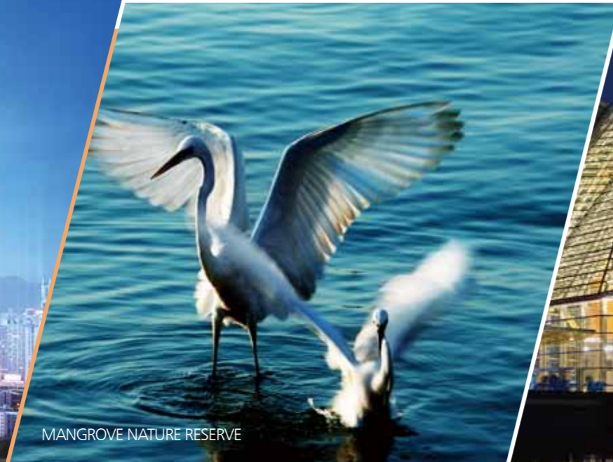
MANGROVE NATURE RESERVE