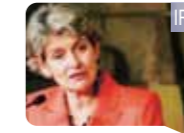
IRINA BOKOVA, DIE UNESCO-GENERALDIREKTORIN

Shenzhen ist eine saubere und grüne Stadt, und das Layout der gesamten Stadt und die Gebäude haben den Sinn für Design, hat eine ausgeprägte Vitalität und Individualität. Shenzhen ist eine eindrucksvolle, sehr dynamisch, nachhaltige Stadt. Meine aufrichtigsten Wünsche zu Shenzhen's Menschen