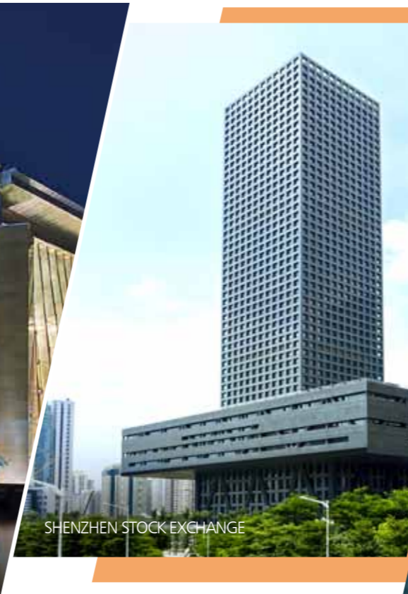
SHENZHEN STOCK EXCHANGE