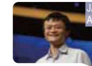
JACK MA, DER VORSITZENDE DES VORSTANDS DER ALIBABA GRUPPE

Shenzhen's Entwicklung jenseits meiner Vorstellungskraft, und innerhalb von 30 Jahre eine solche Leistung zu erhalten, ist ein Wunder