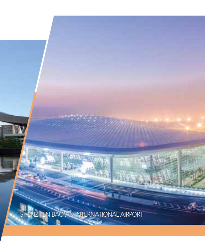
SHENZHEN BAO'AN INTERNATIONAL AIRPORT