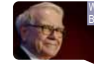
WARREN BUFFETT, DER VORSTANDSVORSITZENDE VON BERKSHIRE HATHAWAY

Kultur ist der Schlüssel zu einer nachhaltigen Entwicklung, und Shenzhen ist eines der Prinzipien der Praxis