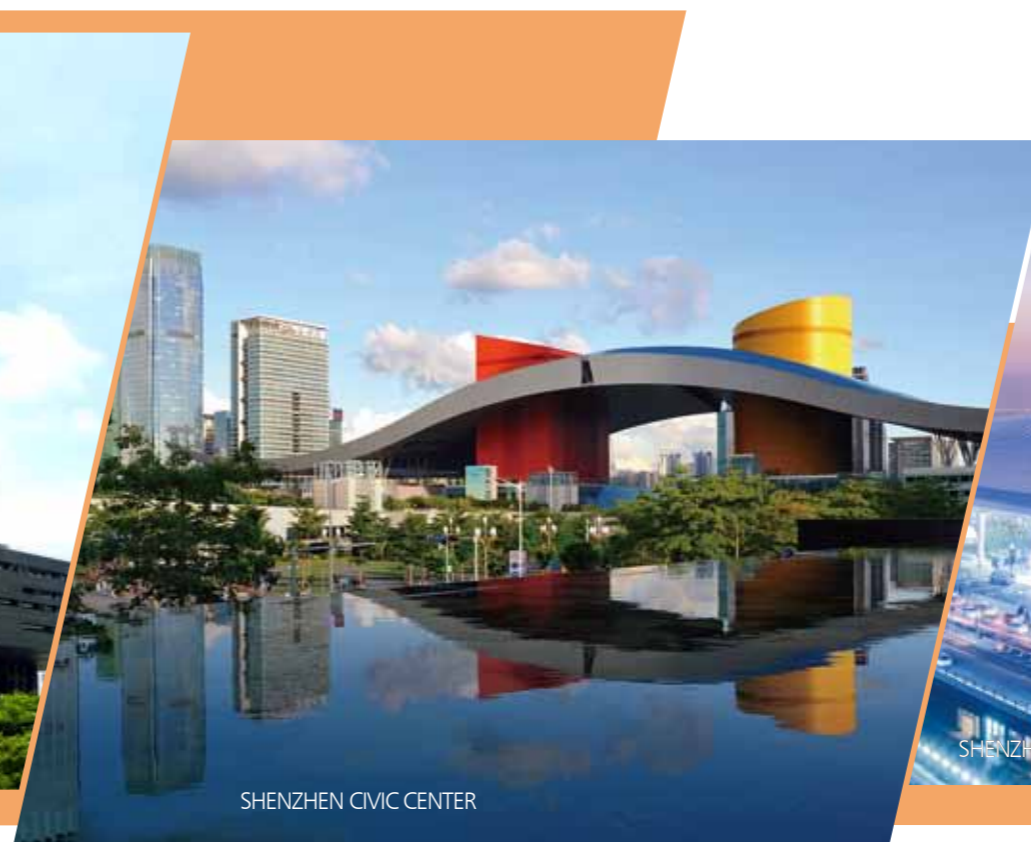
SHENZHEN CIVIC CENTER