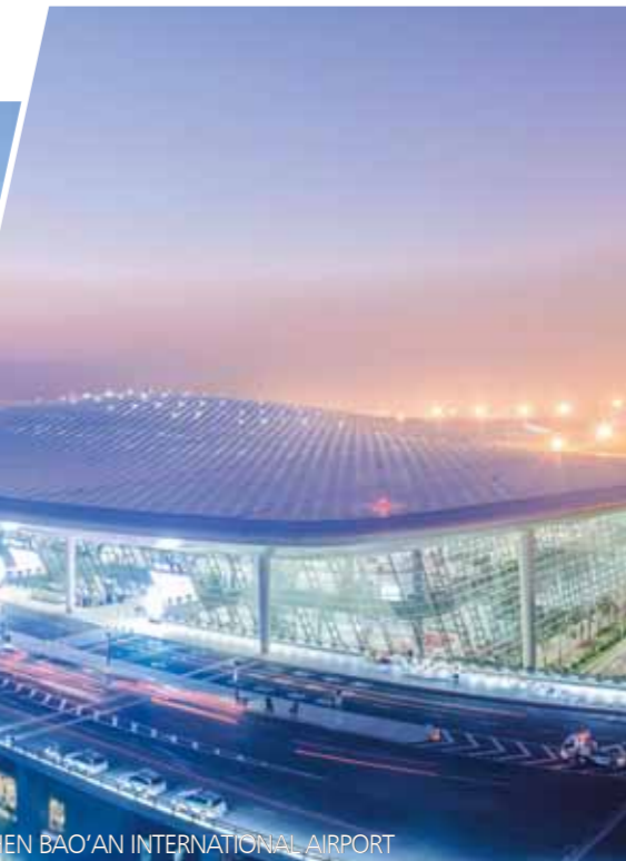
SHENZHEN BAO'AN INTERNATIONAL AIRPORT