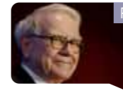
PRESIDENT OF BERKSHIRE HATHAWAY, BUFFETT

Kultur er nøglen til bæredygtig udvikling, og Shenzhen udlever dette princip.