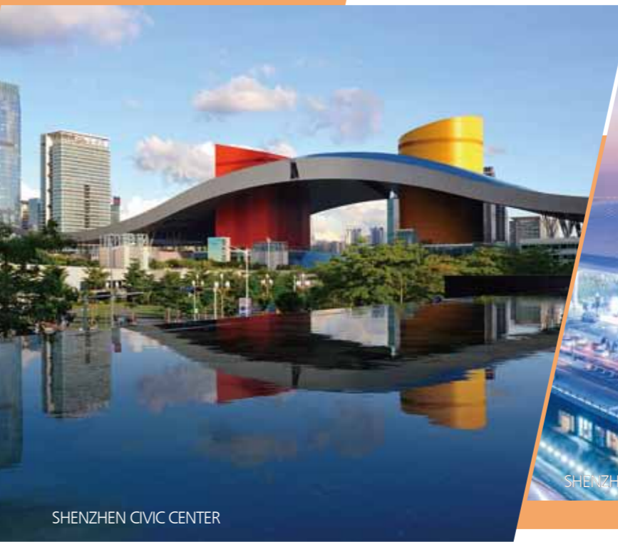
SHENZHEN CIVIC CENTER