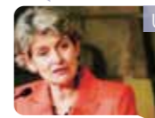
UNESCO DIRECTOR GENERAL, IRINA BOKOVA

Shenzhen er en ren og grøn by, byens layout har en tydelig sans for design, og er fyldt med vitalitet og individualitet. Shenzhen er en imponerende, dynamisk, bæredygtig by. Jeg ønsker folket i Shenzhen det bedste.