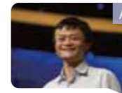
ALIBABA GROUP CHAIRMAN OF THE BOARD, JACK MA

Udviklingen af Shenzhen overgår ud over min fantasi, det er et mirakel at have nået så meget på 30 år.