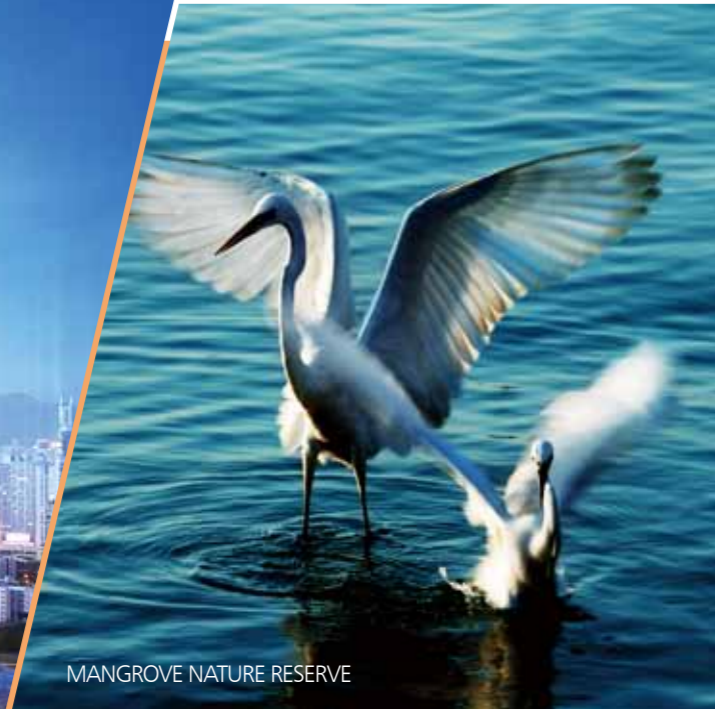
MANGROVE NATURE RESERVE