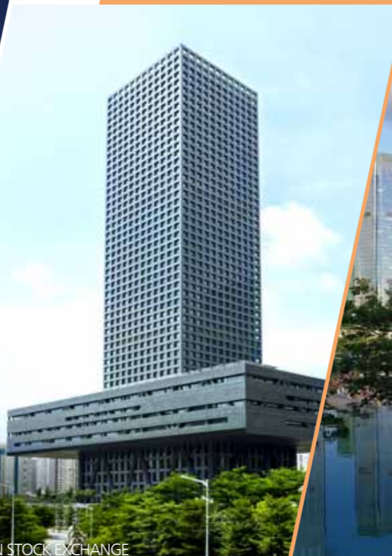
SHENZHEN STOCK EXCHANGE