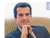
RUI MOREIRA, MAYOR OF PORTO

Jeg elsker Shenzhens byplan, især dens focus på smart design. Shenzhen er en moderne by med en stærk innovativ atmosfære. Det er også en international by, og mange canadiske virksomheder tager det kinesiske marked igennem Shenzhen.