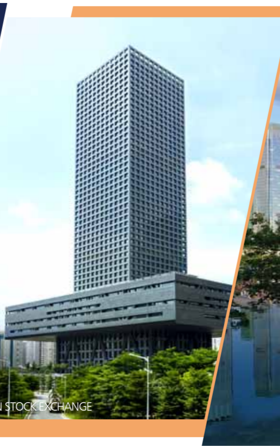
SHENZHEN STOCK EXCHANGE