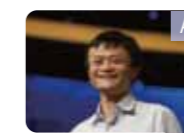
ALIBABA GROUP STYRELSEORDFÖRANDE, JACK MA

Utvecklingen av Shenzhen är bortom min fantasi, och det är ett mirakel att uppnå sådana resultat i 30 år.