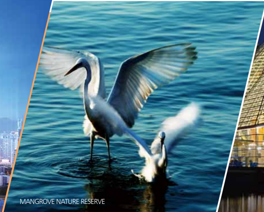
MANGROVE NATURE RESERVE