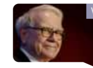
VD FÖR BERKSHIRE HATHAWAY, BUFFETT

Kultur är nyckeln till en hållbar utveckling, och Shenzhen är den som väl förtrogen med principerna.