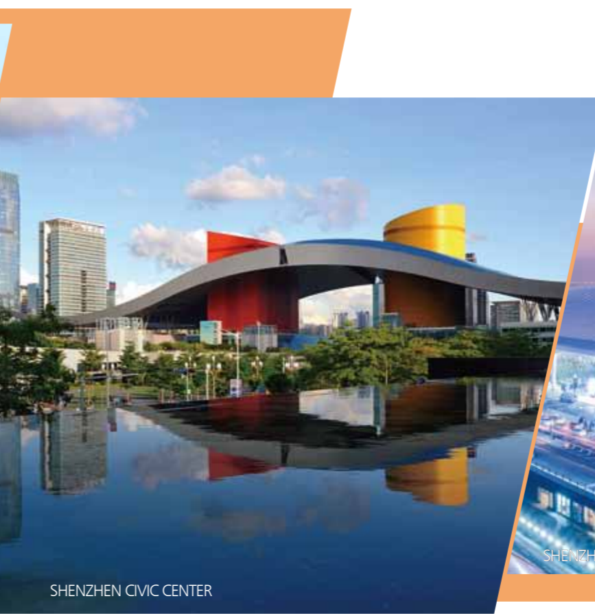
SHENZHEN CIVIC CENTER