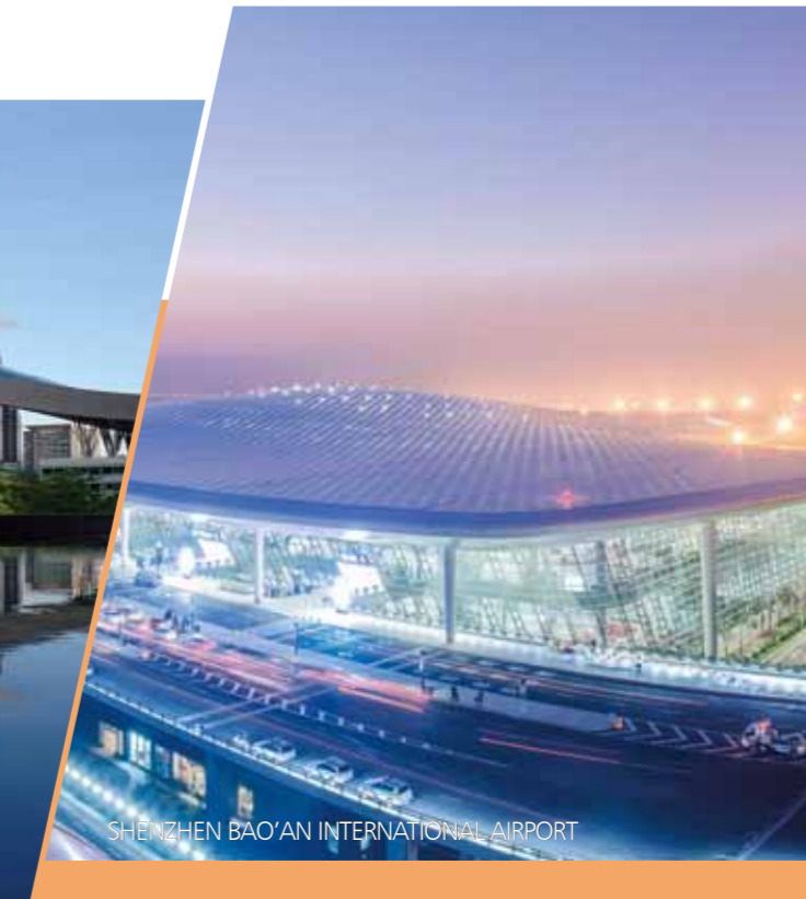
SHENZHEN BAO'AN INTERNATIONAL AIRPORT