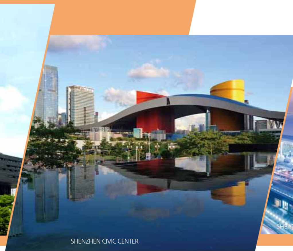
SHENZHEN CIVIC CENTER