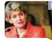
MME IRINA BOKOVA DIRECTRICE GÉNÉRALE DE L'UNESCO

Shenzhen est une ville propre et verte, la structure et la construction de toute la ville sont riches en conception avec le dynamisme bien voyant et des couleurs personnalisées. Shenzhen est une ville très impressionnante, très dynamique avec le développement durable. Je donne aux Shenzhenais le souhait le plus sincère.