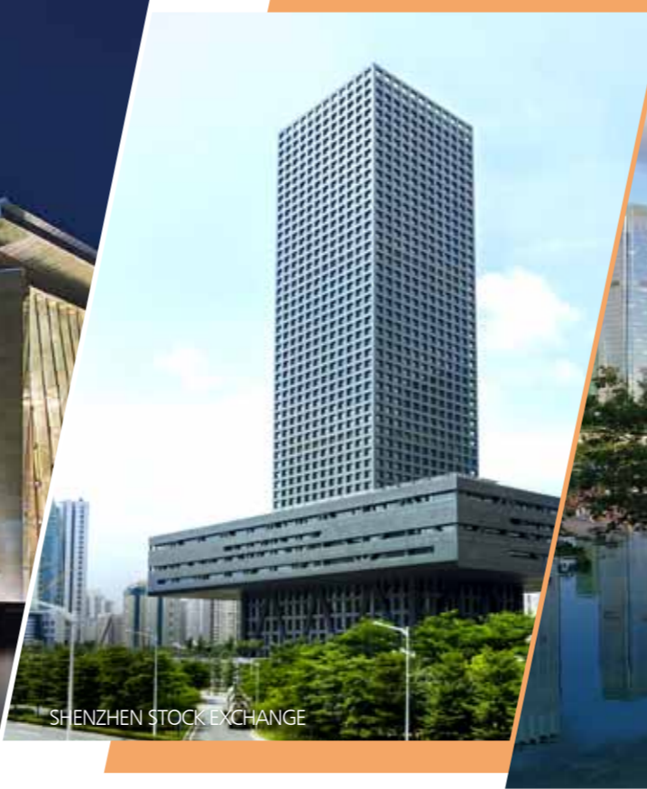
SHENZHEN STOCK EXCHANGE