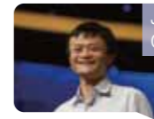
JACK MA PRÉSIDENT DU CONSEIL D'ADMINISTRATION DU GROUPE ALIBABA

Le développement de Shenzhen dépasse mon imagination, c'est un vrai miracle d'avoir obtenu tel succès dans 30 ans.