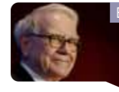
BUFFET PRÉSIDENT DE LA SOCIÉTÉ WESCO

La culture est la clé dans le développement durable, Shenzhen est le praticien de ce principe.