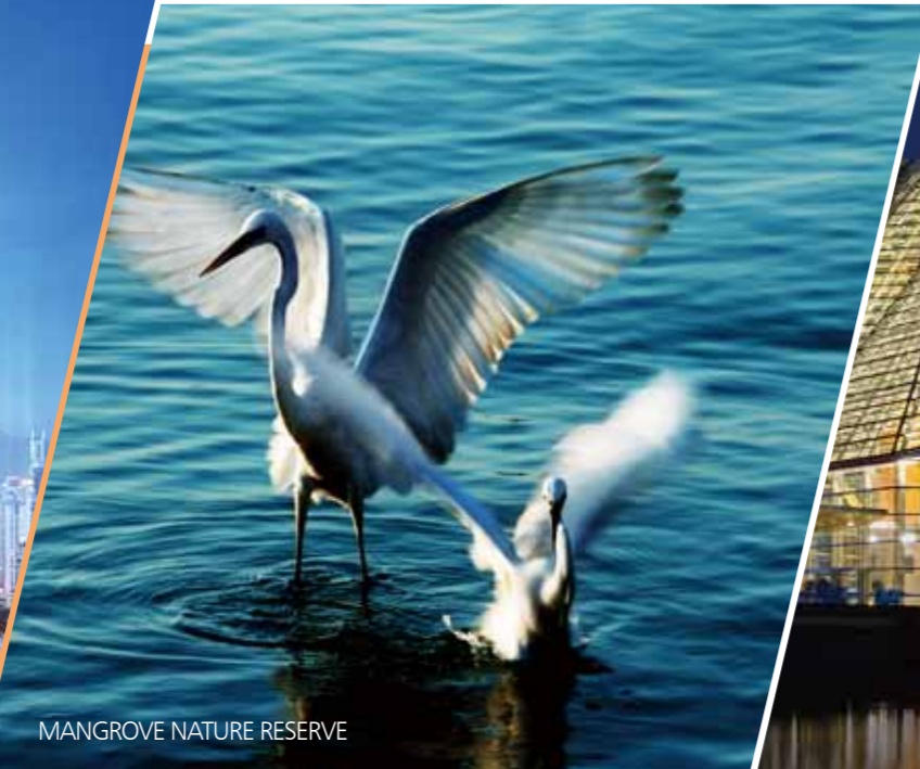
MANGROVE NATURE RESERVE