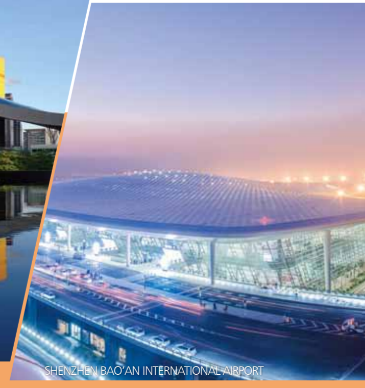
SHENZHEN BAO'AN INTERNATIONAL AIRPORT