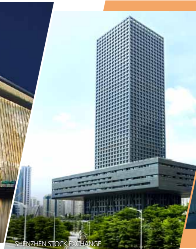
SHENZHEN STOCK EXCHANGE