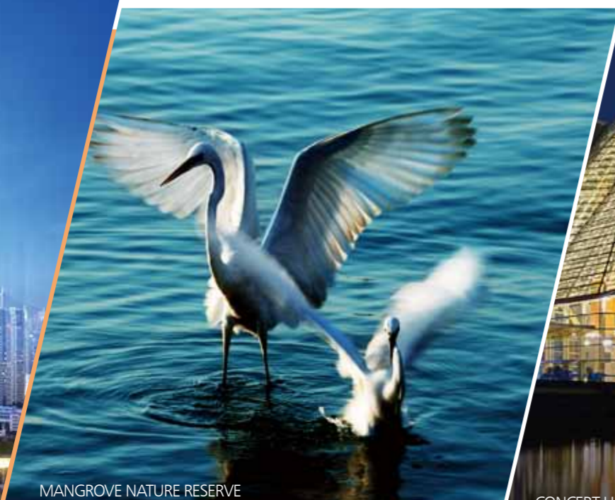
MANGROVE NATURE RESERVE