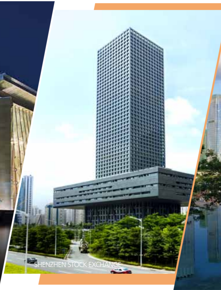
SHENZHEN STOCK EXCHANGE