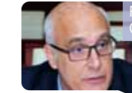
FRANCESCO BNADARIN, DIREKTOR DARI WORLD HERITAGE CENTER

Shenzhen merupakan kota bersih dan hijau, tata ruang shenzhen disusun dengan bagus dan desain bangunan berklas yang menunjukkan energy dan karakter Shenzhen. Dan Shenzhen juga merupakan kota terkesan ramah, dan berkembang berlanjutan, dan saya memberi harapan saying yang tulus kepada masyarakat Shenzhen