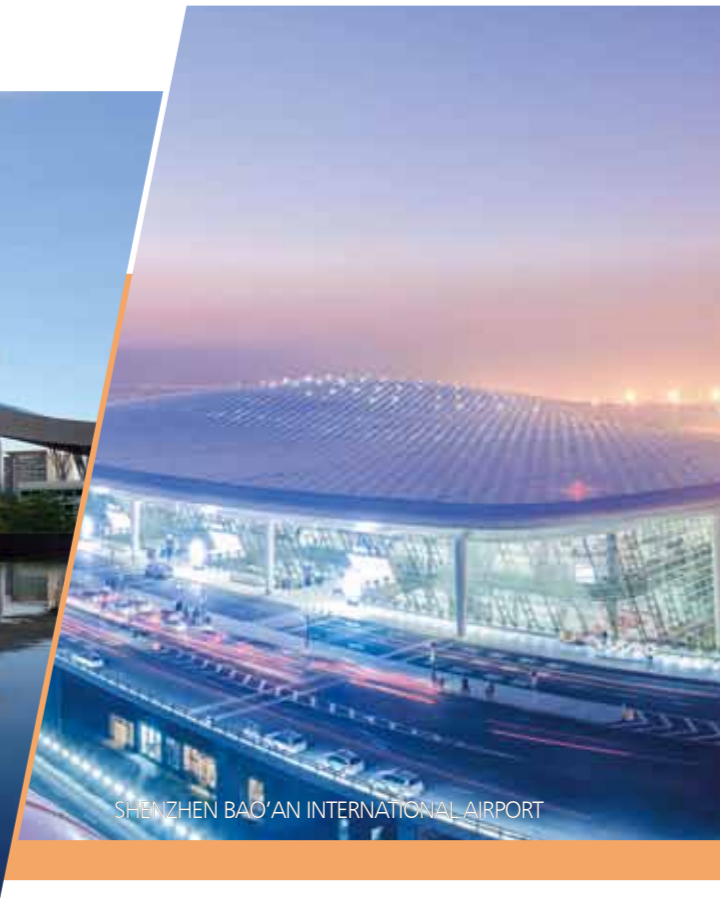
SHENZHEN BAO'AN INTERNATIONAL AIRPORT