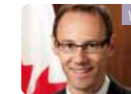
WELDON EPP, KONSUL JENDERAL KANADA DI GUANGZHOU

Shenzhen adalah kota magis. Dalam waktu pendek, Shenzhen sudah mencapai hasil yang harus dikerjakan bertahun-tahun untuk kota lain. Saya datang ke Shenzhen tiap berapa tahun, dan menyaksikan perkembangan Shenzhen. Dan bagi saya, Shenzhen sekarang sudah menjadi kota layak huni tidak hanya bagi orang tiangkok tetapi bagi orang dunia