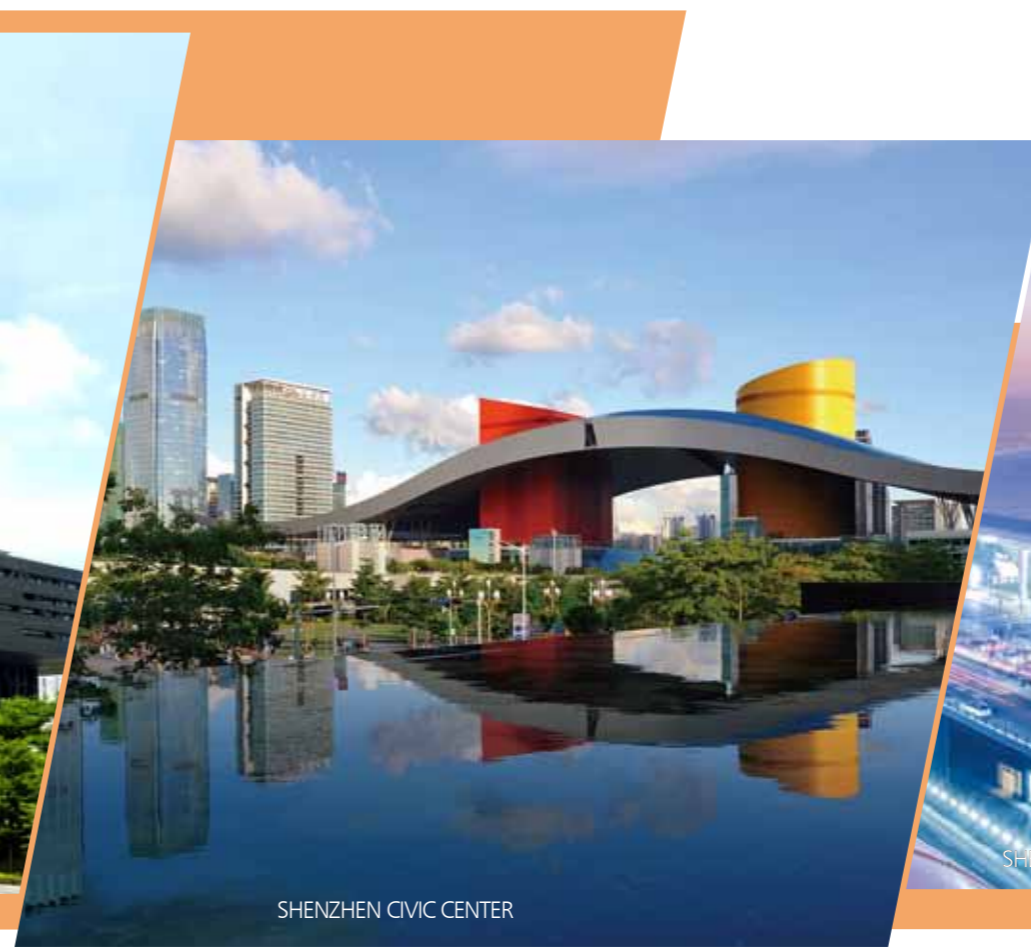
SHENZHEN CIVIC CENTER