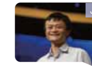
JACK MA, KETUA DARI ALIBABA GROUP

Perkembangan Shenzhen luar biasa, dan dengan 30 tahun perkembangan Shenzhen menjadi satu miracle dalam pembangunannya