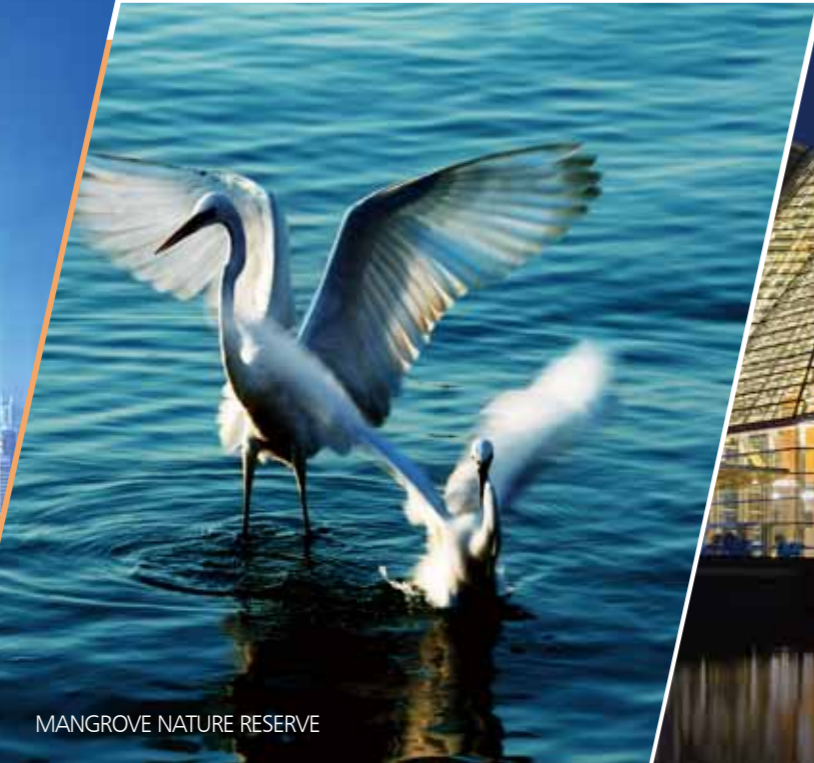
MANGROVE NATURE RESERVE