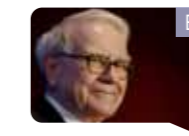
BUFFET, KETUA DARI BERKSHIRE HATHAWAY

Budaya shenzheng adalah kunci perkembangan perlanjutan, dan Shenzhen menjalankan prinsip dengan praktis