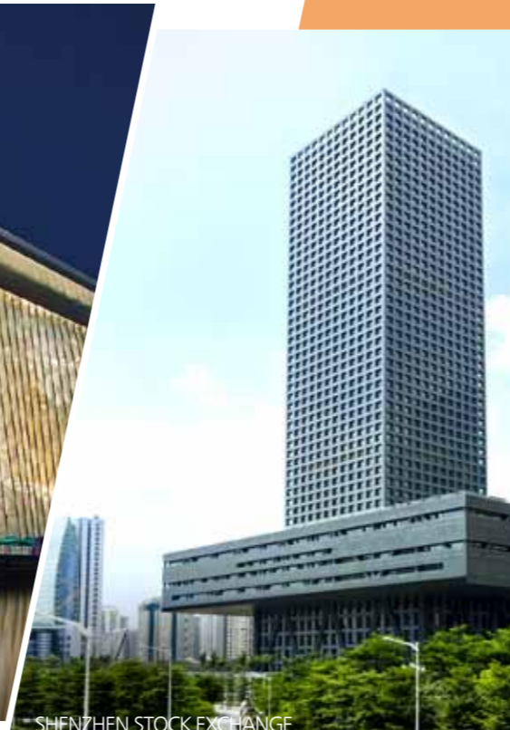
SHENZHEN STOCK EXCHANGE