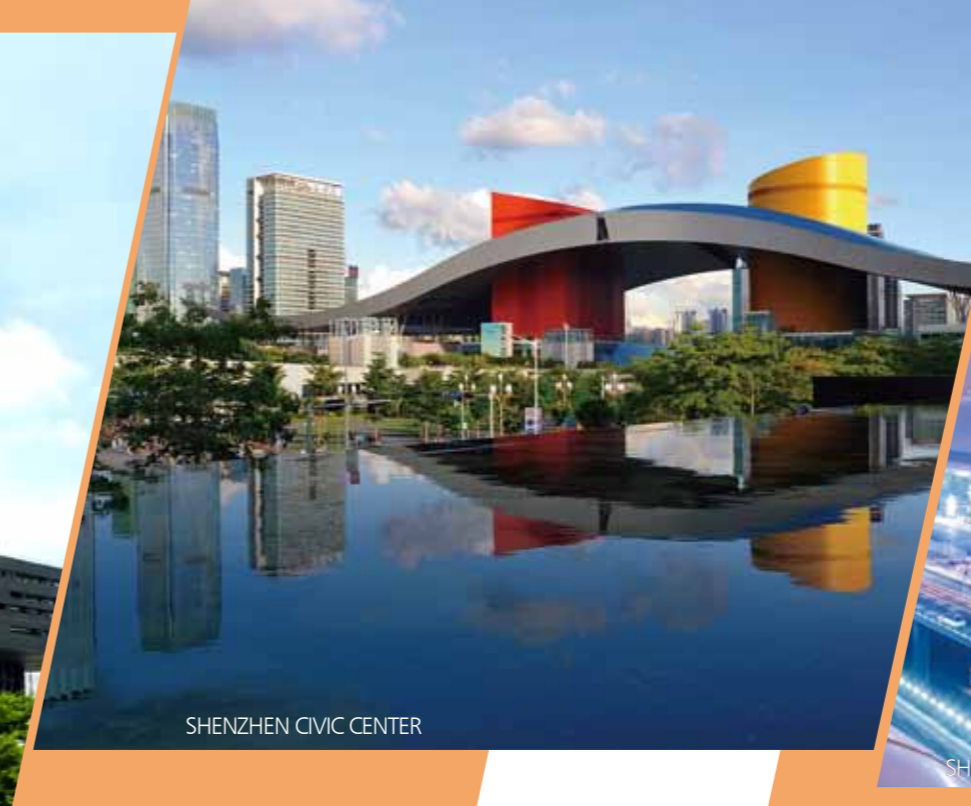
SHENZHEN CIVIC CENTER