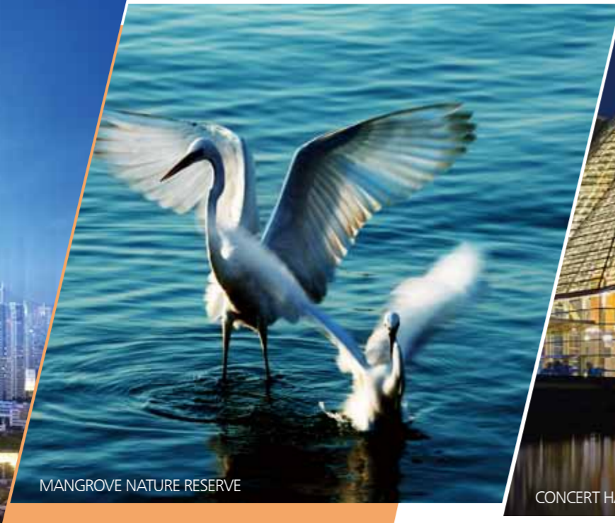
MANGROVE NATURE RESERVE