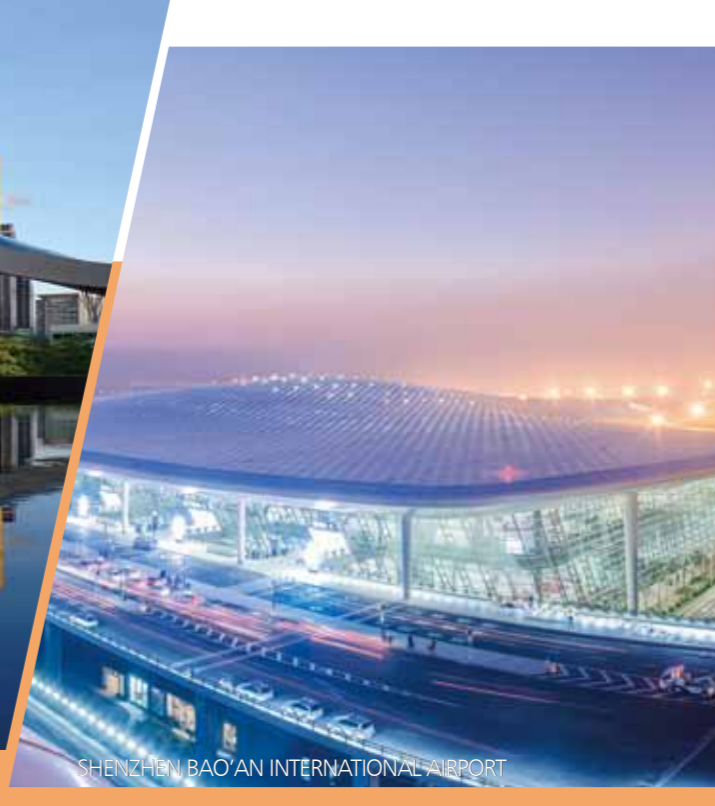
SHENZHEN BAO'AN INTERNATIONAL AIRPORT