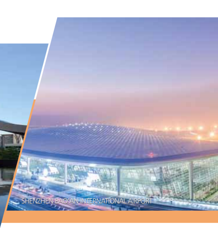
SHENZHEN BAO'AN INTERNATIONAL AIRPORT