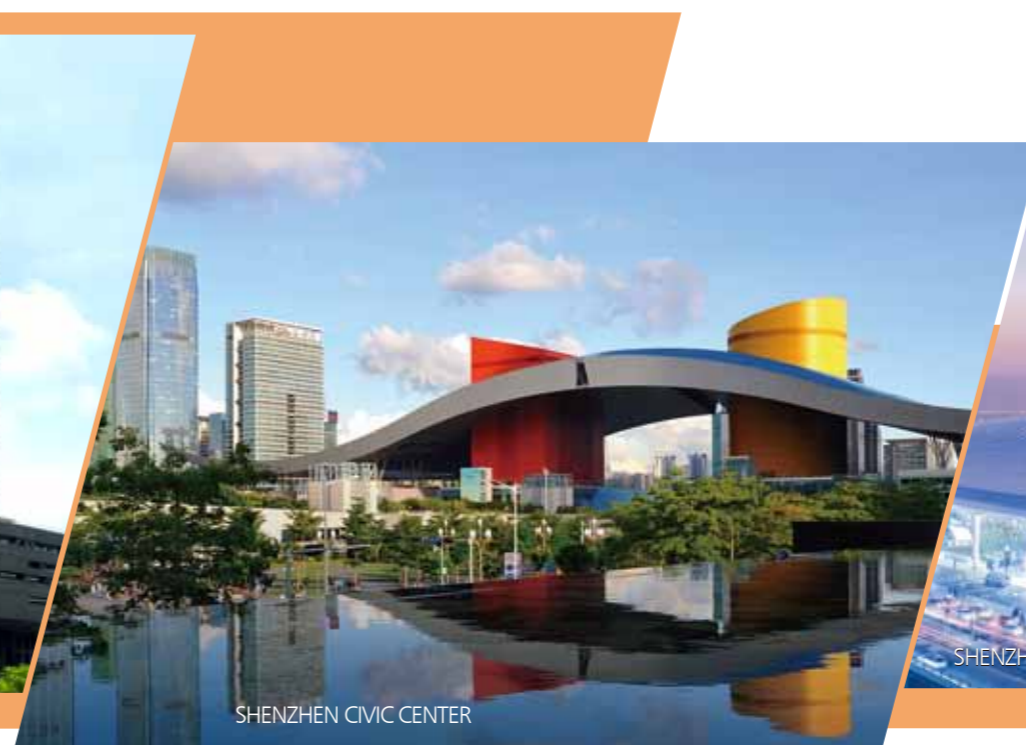
SHENZHEN CIVIC CENTER