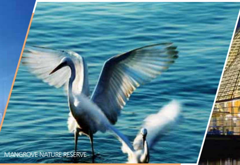
MANGROVE NATURE RESERVE