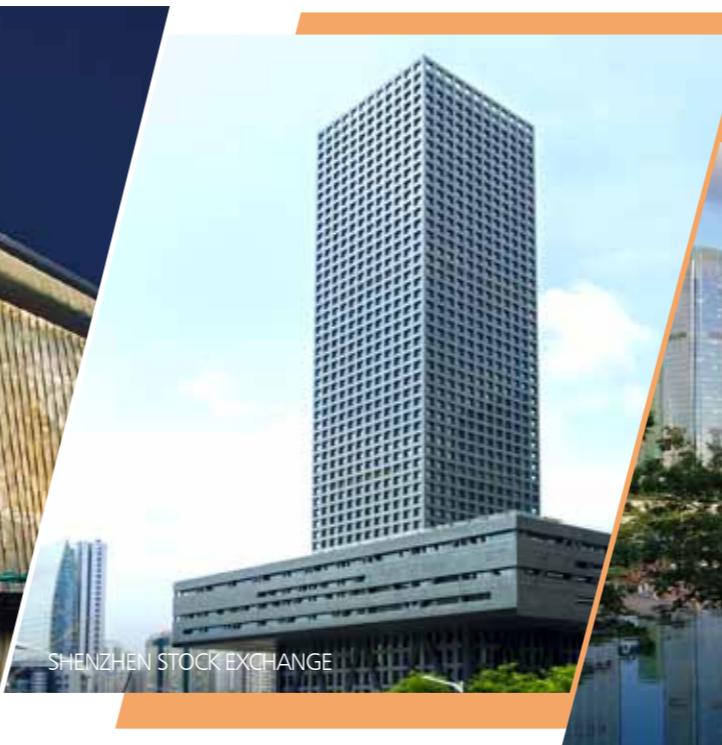
SHENZHEN STOCK EXCHANGE