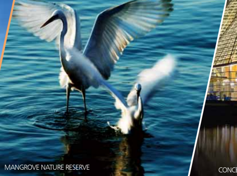
MANGROVE NATURE RESERVE