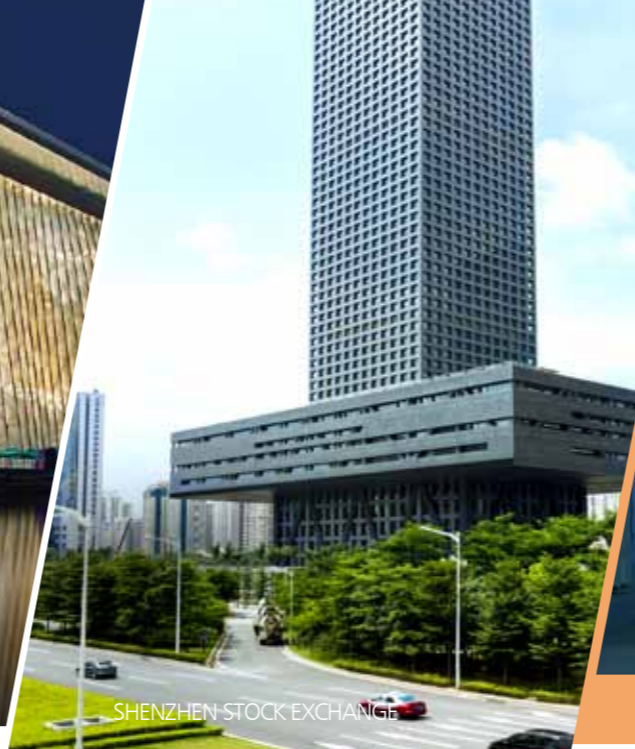
SHENZHEN STOCK EXCHANGE