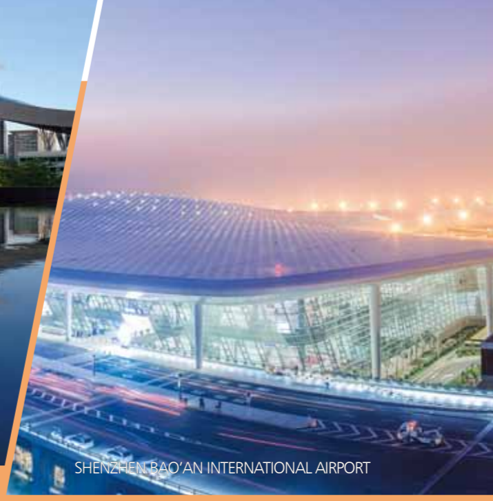
SHENZHEN BAO'AN INTERNATIONAL AIRPORT